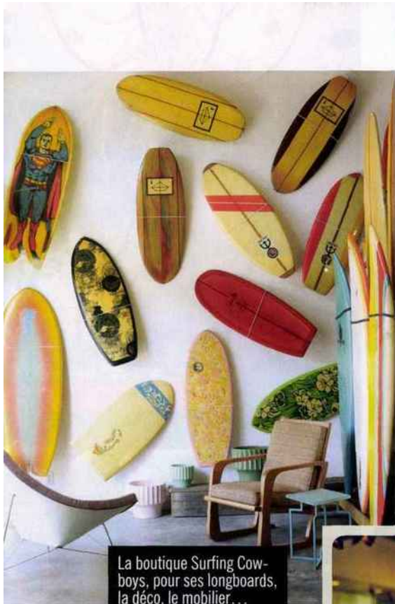
La boutique Surfing Cowboys, pour ses longboards, la déco, le mobilier...