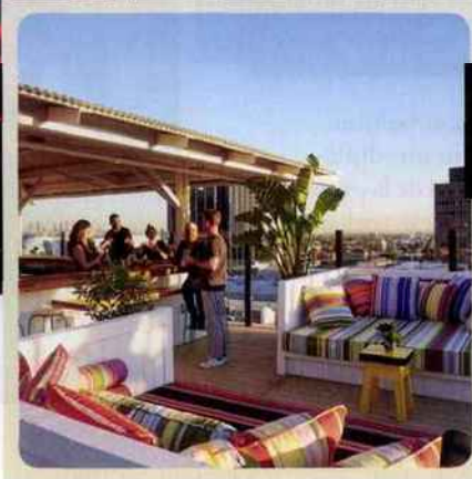
Prendre un verre au Mama Shelter et rêver de cinéma.