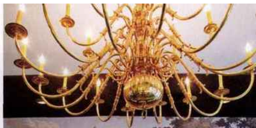
Décor rococo chic du Lamill Coffee.

Dans ce quartier branché, les coffee-shops poussent comme des champignons. Deux options : au Lamill Coffee (1636 Silver Lake Blvd, lamillcoffee.com ), des grains de café sélectionnés en Colombie, au Brésil et au Mexique pour des jus à l'américaine très allongés, dans un décor rococo avec lustres et fauteuils en croco. À L'Intelligentsia (3922 Sunset Blvd, intelligentsiacoffee.com ), des petits noirs serrés à siroter en terrasse, pile au croisement de Sunset et Santa Monica Boulevard, soit l'épicentre de la hype.