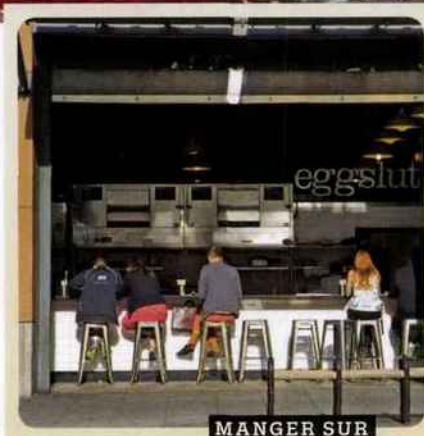
MANGER SUR LE POUCE AU GRAND CENTRAL MARKET

La propriétaire de ce multimarque n'a pas son pareil pour mettre en scène ses