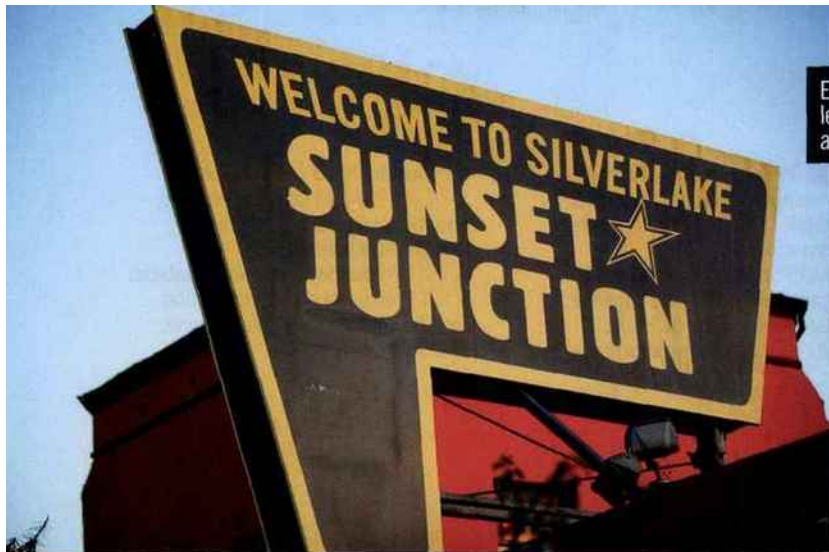
Enseigne vintage dans le quartier branché alternatif de Silver Lake.