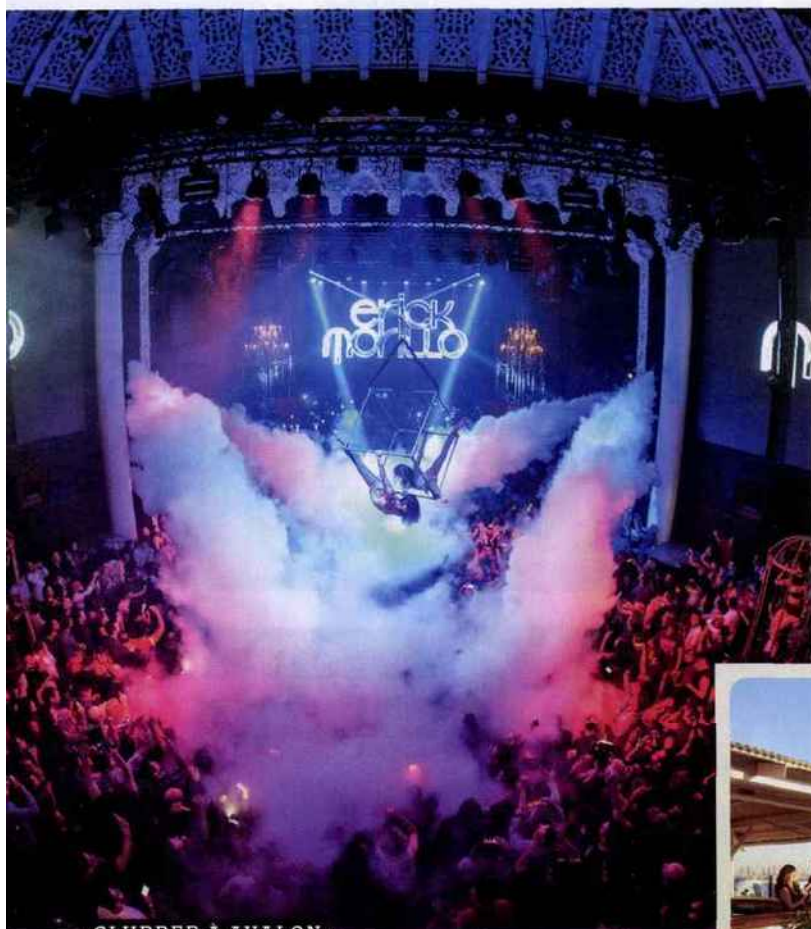
CLUBBER À AVALON

House, techno, électro : ce vieux théâtre de 1927 accueille un haut lieu du clubbing, avec des DJs de légende en lieu et place des Beatles qui provoquèrent ici une émeute dans les sixties. Certains soirs, la musique fait trembler les murs ornés de stucs ! Depuis l'étage supérieur, le bar Bardot tout en velours permet de faire une pause glamour. 1735 Vine Street, avalonhollywood.com .