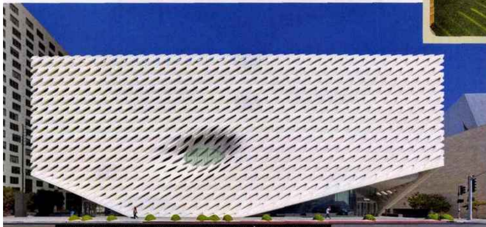
ADMIRER L'ART CONTEMPORAIN À THE BROAD

Ce nouveau musée est spectaculaire avec sa façade futuriste et élégante. À l'intérieur, pas un plasticien coté ne manque à l'appel, de l'Anglais Damien Hirst à l'Allemand Andreas Gursky. Les artistes du pop art ne sont pas oubliés, tel Andy Warhol et ses « Marilyn ». À Otium, le resto du musée, le chef propose des plats de cow-boy dans la pure tradition tex-mex : viandes rouges cuites au barbecue, chili con carne et maïs grillé. 221 S Grand Ave, thebroad.org.