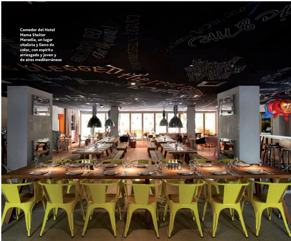
Comedor del Hotel Mama Shelter Marsella, un lugar vitalista y lleno de color, con espíritu arriesgado y joven y de aires mediterráneos